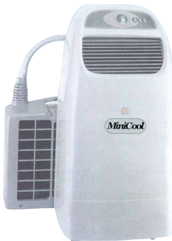
Mini Cool M9-A Art nr: 010407